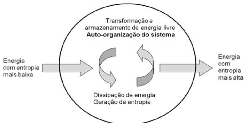
Figura 1 - Esquema geral de uma estrutura dissipativa.

Por outro lado, entendemos que destacar os fundamentos termodinâmicos da economia, de forma a poder situar adequadamente as sociedades humanas na biosfera, não implica em naturalizar tais sociedades, passando a interpretar as suas dinâmicas principalmente a partir de suas características físicas, químicas e biológicas. É justamente isto que nos parece fazer Beinhocker (2006), ao considerar os mercados das sociedades contemporâneas como "ecossistemas em evolução" ("evolving ecosystems", no original), na medida em que estes são movidos pela competição entre os agentes econômicos, a qual é considerada pelo autor como um mecanismo básico e universal de